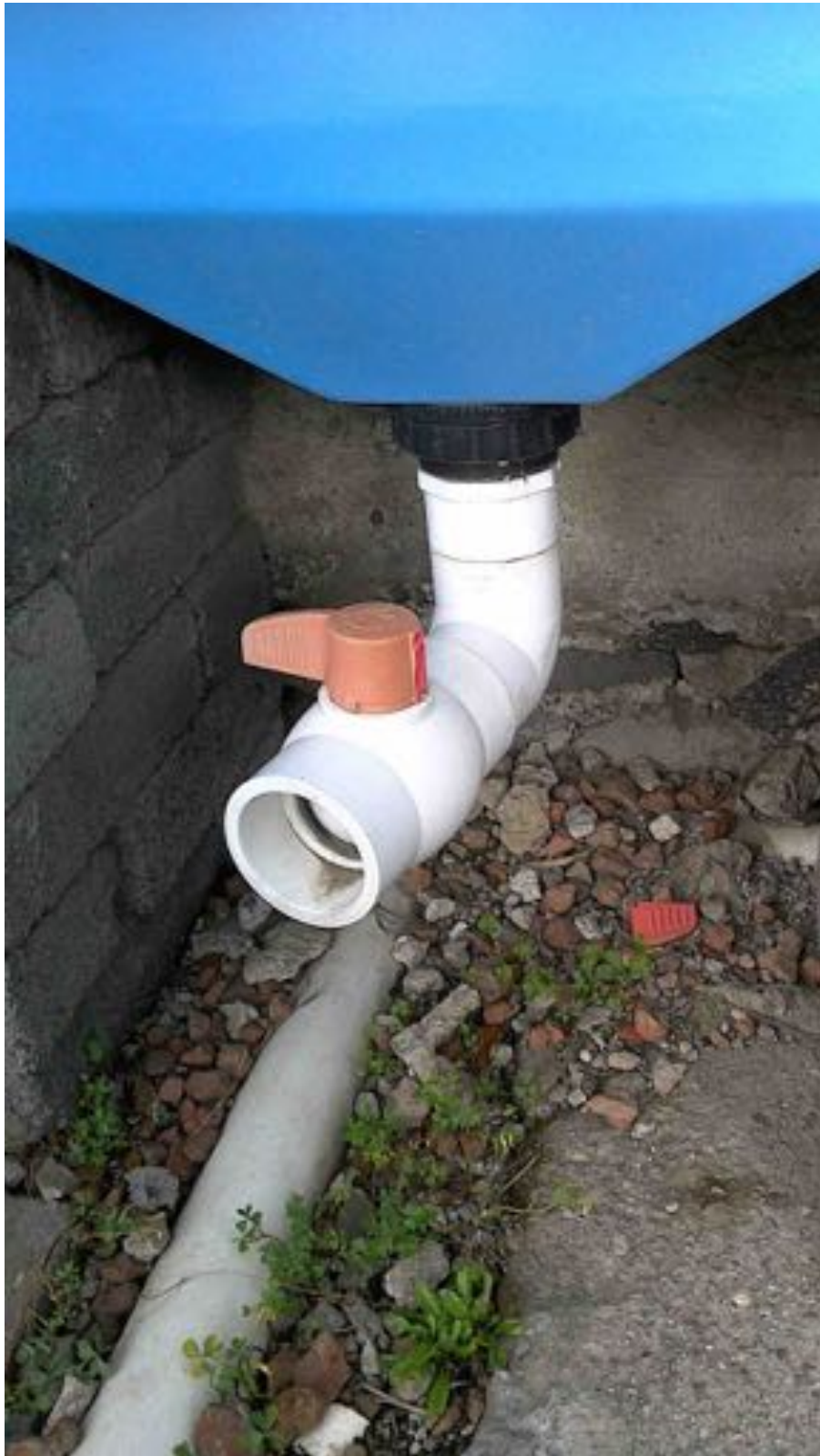
Ilustración 4: Llave de salida de agua rota y cerrada. En muchos casos la llave está muy dura y le es muy difícil al usuario drenar el sistema