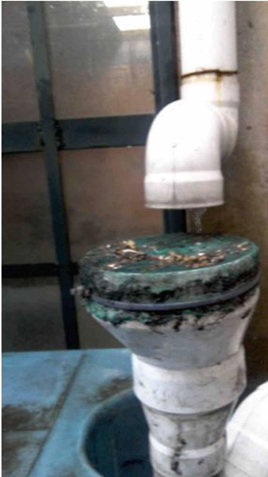
Ilustración 7: Filtro de hojas sucio