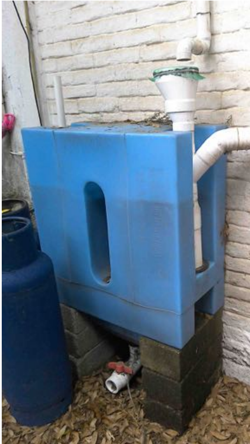
Ilustración 3: Tlaloque lleno de agua. En muchos casos se encontró el Tlaloque lleno de agua porque el usuario no permite el drenado del mismo