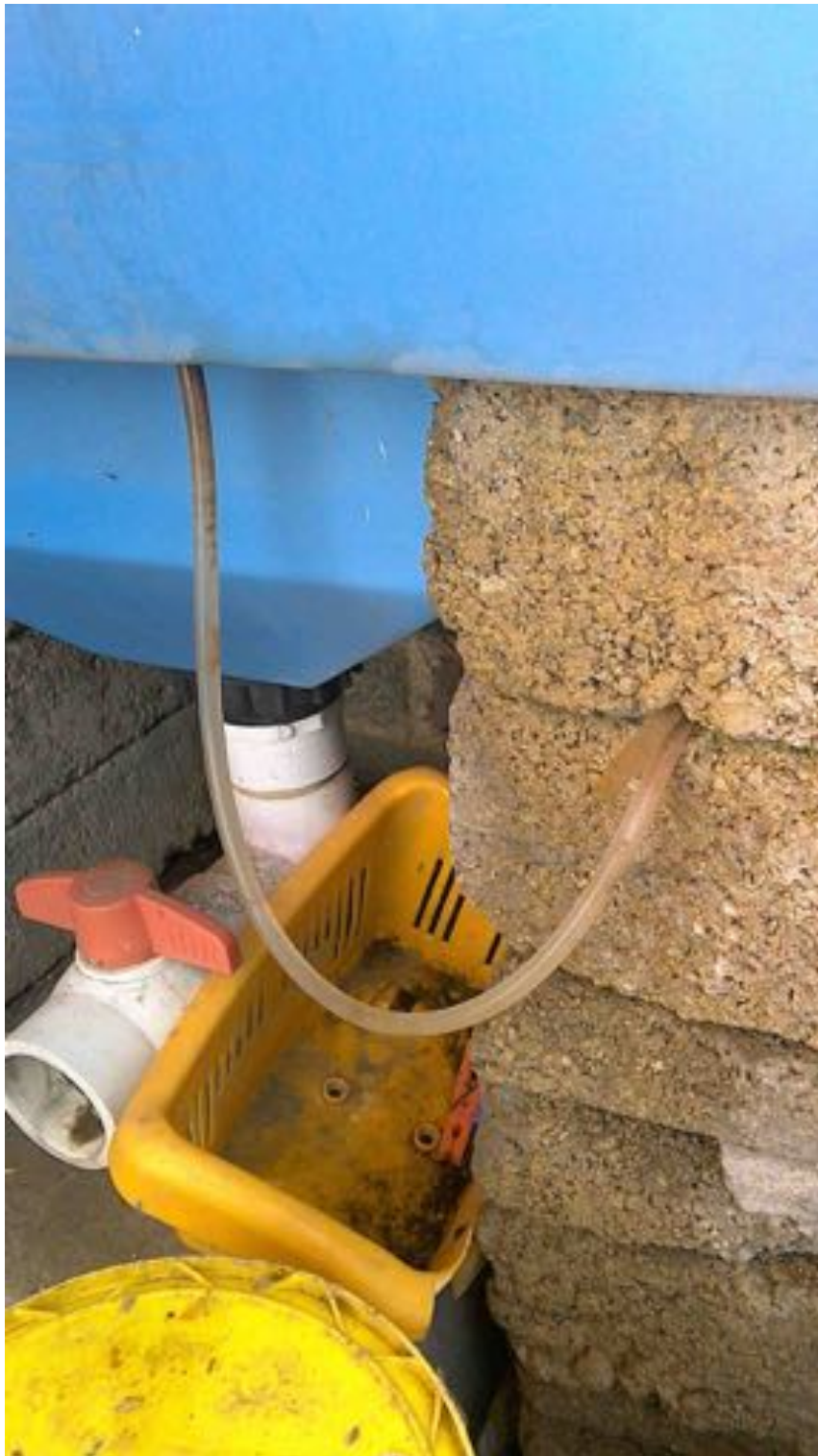
Ilustración 8: Manguera de drenado modificada para que no salga el agua