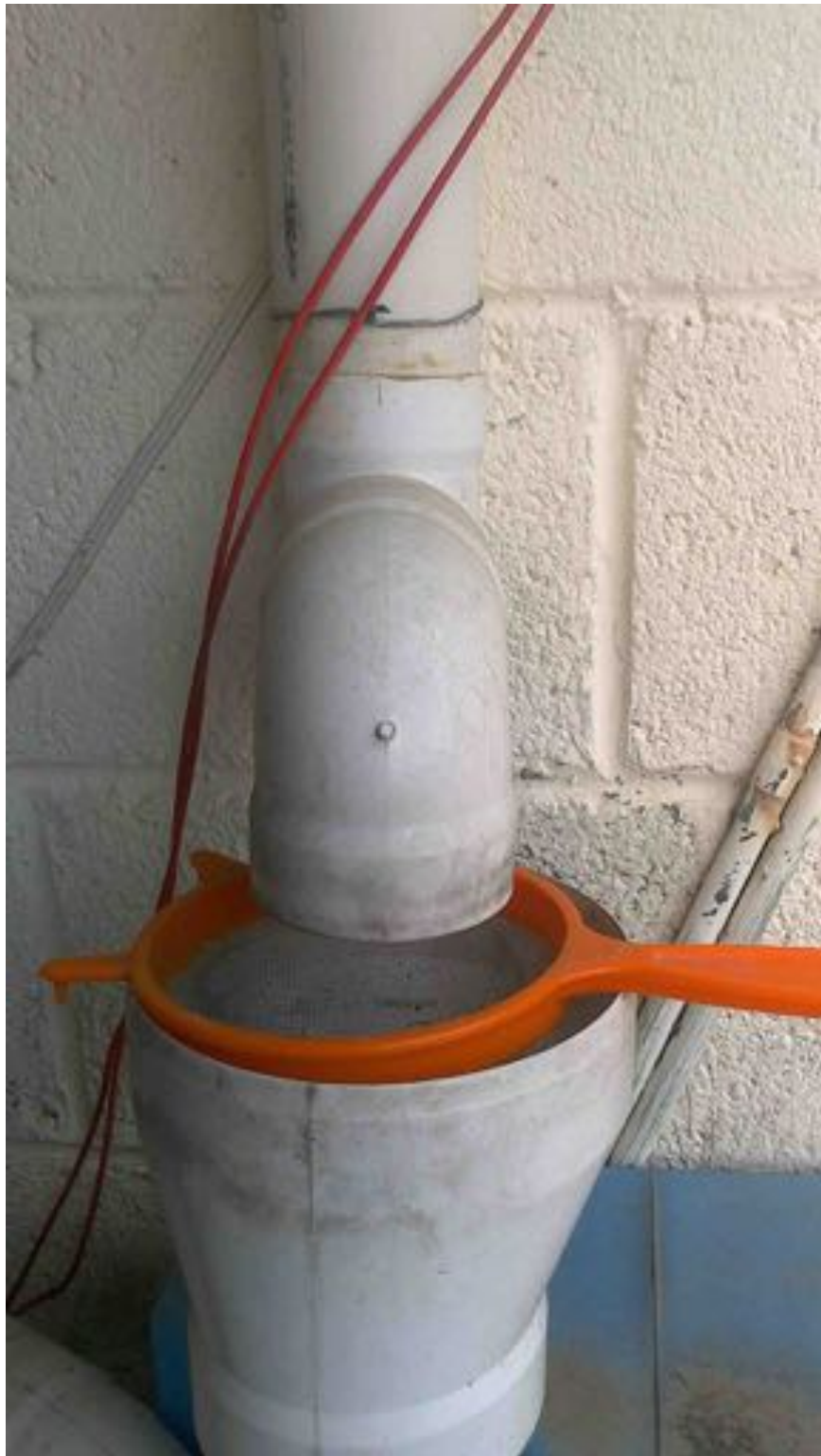
Ilustración 6: Filtro de hojas modificado