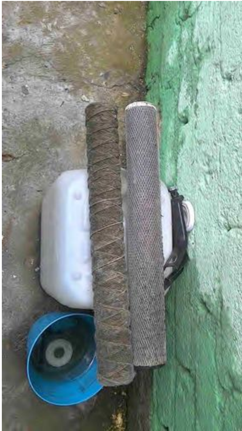
Ilustración 2: Filtros de agua sucios y sin cambiar. Algunos usuarios no cambian los filtros y continúan utilizándolos de esta forma. Otros lavan o limpian los filtros y siguen utilizándolos pensando que esta medida es suficiente para limpiar el agua