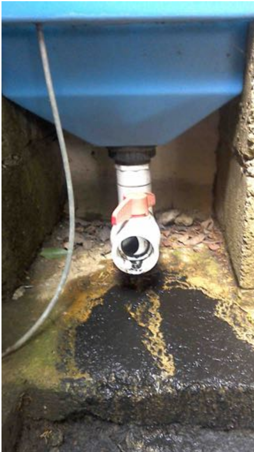
Ilustración 5: Residuos del drenaje del Tlaloque. Este sistema no se había drenado y el equipo de trabajo lo hizo para explicarle al usuario la importancia de hacerlo