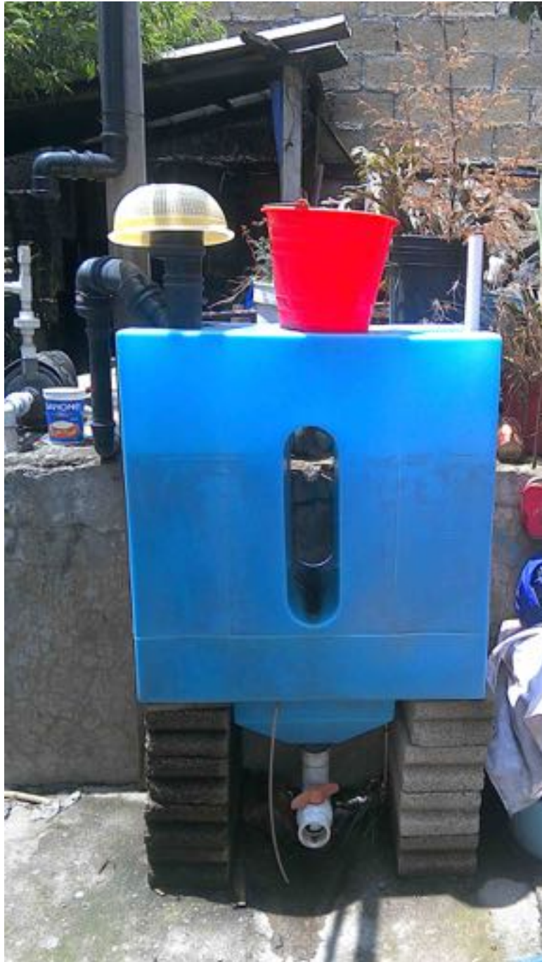
Ilustración 1: Tlaloque con línea de suciedad por dentro