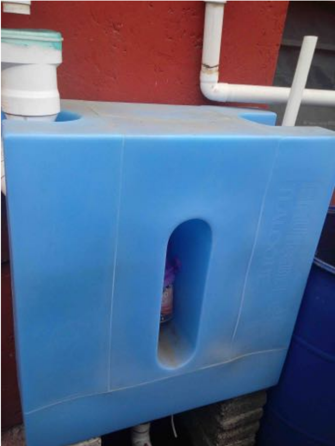
Ilustración 9: Tlaloque bien cuidado